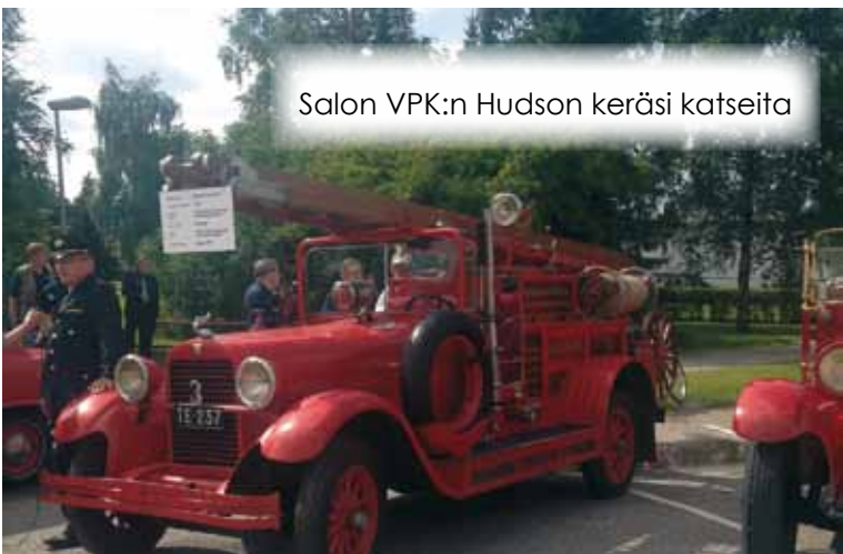
Salon VPK:n Hudson keräsi katseita