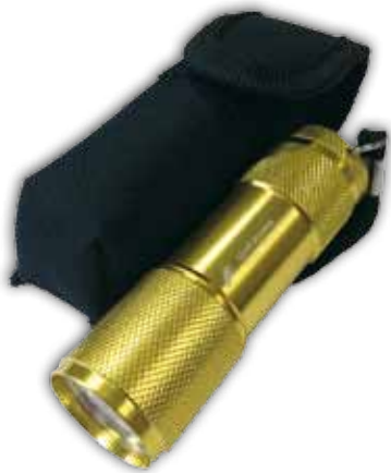
LSPeL led valaisin, +suojakotelo 6,00€