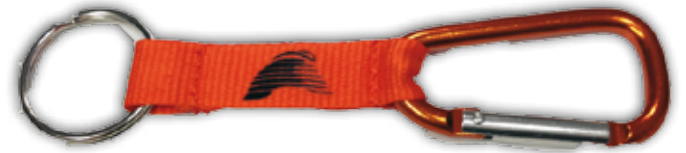
Karabiiniavainhaka, oranssi 3,00€