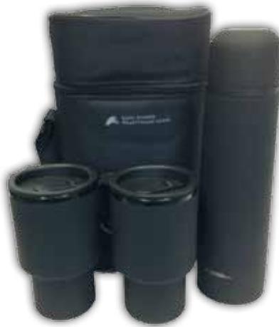
Termosetti: 2x termosmuki, termospullo ja kantolaukku 25,00€