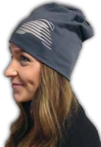
LSPeL pipo, heijastava logo 12,00€