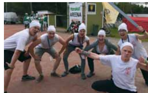
Tiedotuksen joukkue voitontahtoisena leiriolympialaisissa