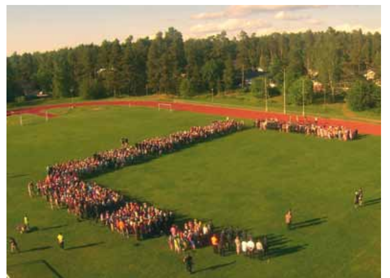
Koko leiri yhdessä kentällä valmiina avajaisiin