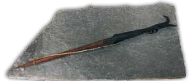
Palohaka, kivilaatatalla (lahjaesine) 109,00€