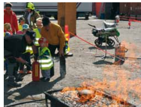
Leirin pienimmätkin pääsivät taltuttamaan liekkejä