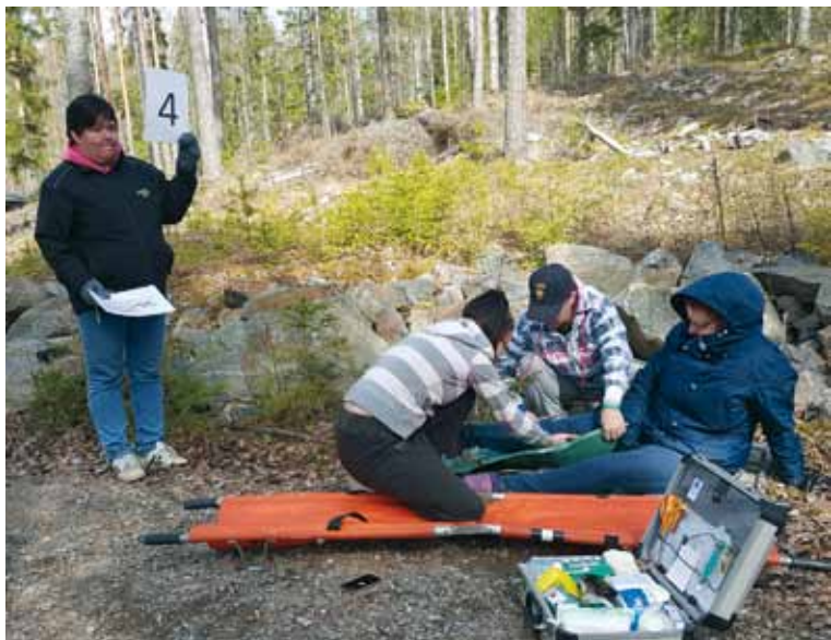
Mimmin Malja -kilpailu käytiin lauantaina 23.4.