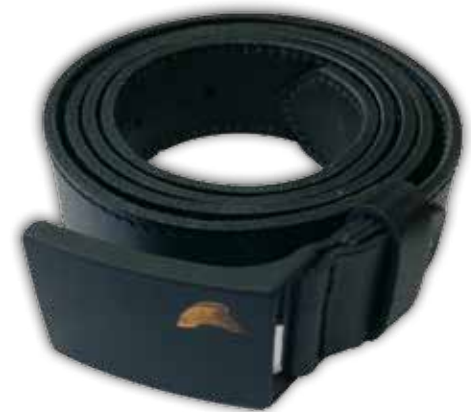
Nahkavyö, musta 30,00€

Lisää tuotteita: www.lspel.fi Tilaukset: myynti@lspel.fi