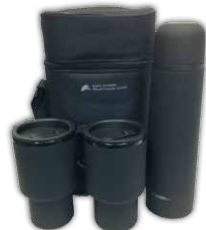
Termosetti: 2x termosmuki, termospullo ja kantolaukku 25,00€